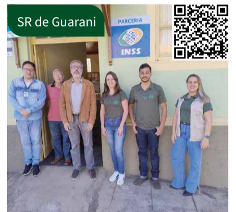
SR de Guarani