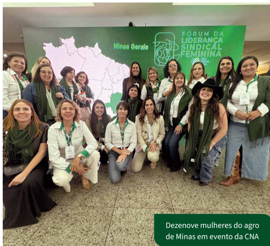
Dezenove mulheres do agro de Minas em evento da CNA