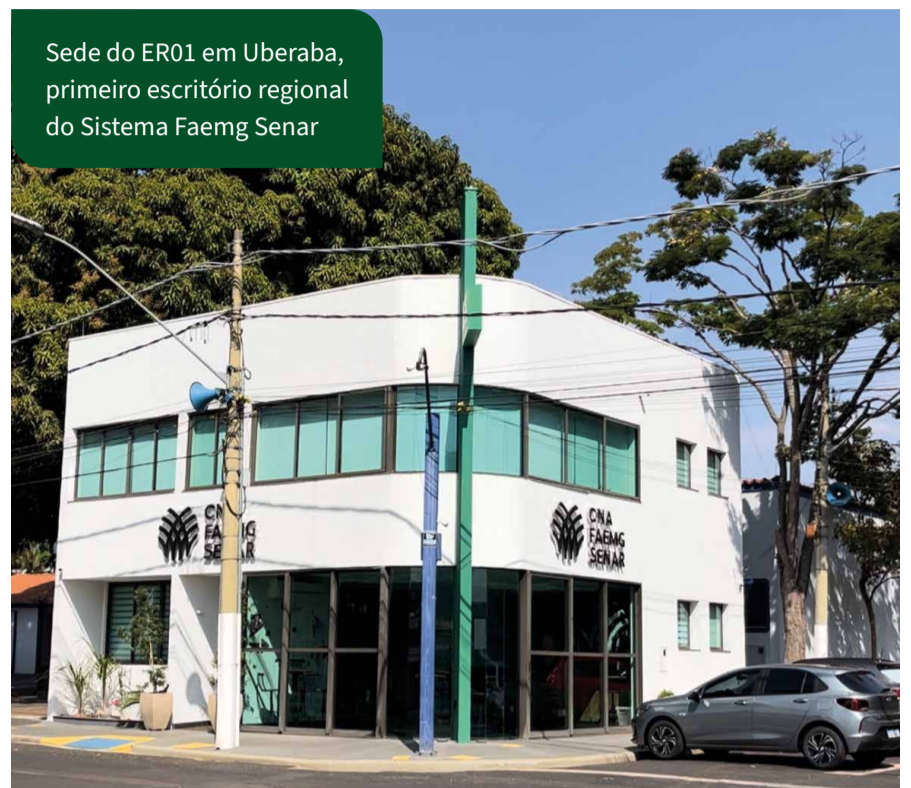
Sede do ER01 em Uberaba, primeiro escritório regional do Sistema Faemg Senar

ER01 abriu caminho para maior aproximação com os produtores rurais da região