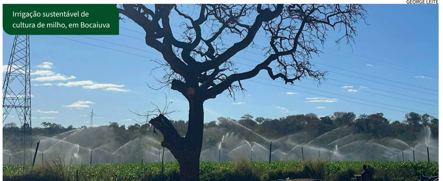
Irrigação sustentável de cultura de milho, em Bocaiuva

A lei, sancionada pelo governador Romeu Zema, foi aprovada após nove anos de tramitação na Assembleia Legislativa. De autoria do deputado Antônio Carlos Arantes, o projeto inicial foi anexado a outra proposta