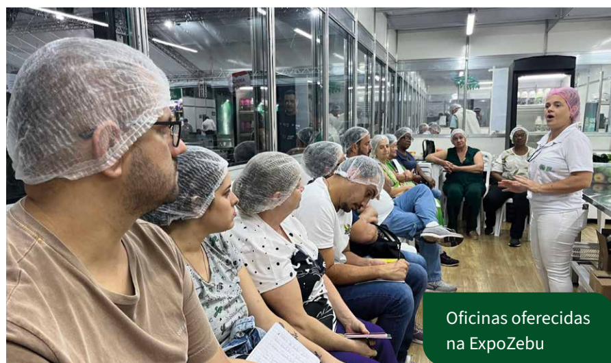
Oficinas oferecidas na ExpoZebu

O escritório também atua ativamente na comunidade, promovendo oficinas e cursos em grandes feiras agropecuárias como a ExpoZebu, a FemeC, a Megacana, a Fenicafé e a ExpoQueijo, disseminando conhecimento e conectando produtores rurais com as últimas tendências do mercado.