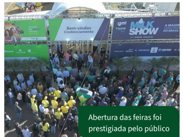
Abertura das feiras foi prestigiada pelo público

dedorismo e uma nova perspectiva para o setor agropecuário brasileiro. O evento foi uma oportunidade de aprendizado com essas líderes, trocar experiências e se inspirar com suas trajetórias, destacando como as mulheres estão transformando o cenário do agronegócio.