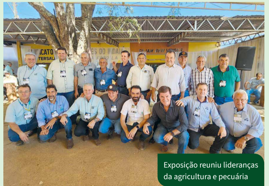
Exposição reuniu lideranças da agricultura e pecuária