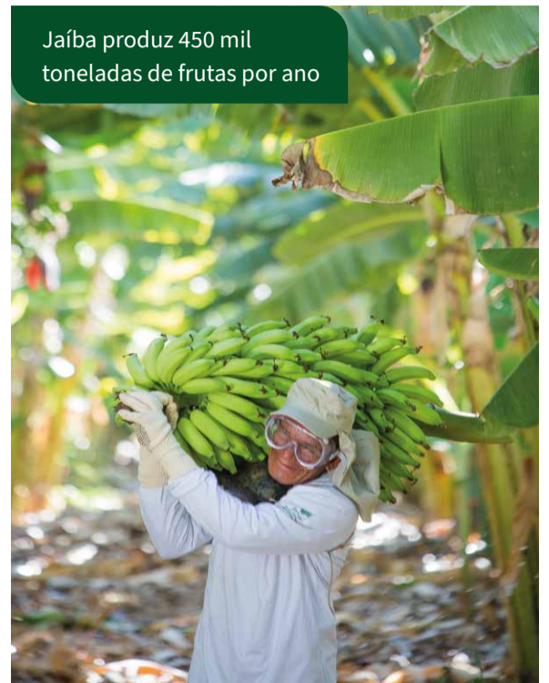
Jaíba produz 450 mil toneladas de frutas por ano

A região do Jaíba é referência em fruticultura, com indicação geográfica de procedência reconhecida pelo Instituto Nacional da Propriedade Industrial (INPI) para banana, manga, ma-