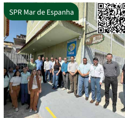
SPR Mar de Espanha