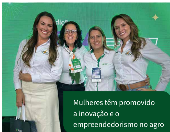
Mulheres têm promovido a inovação e o empreendedorismo no agro

dedorismo e uma nova perspectiva para o setor agropecuário brasileiro. O evento foi uma oportunidade de aprendizado com essas líderes, trocar experiências e se inspirar com suas trajetórias, destacando como as mulheres estão transformando o cenário do agronegócio.